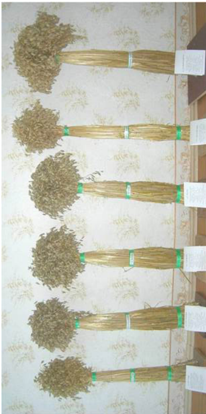
Рисунок 3. Сорта овса: Мустанг, Тогурчанин, Таежник, Метис, Писаревский, Нарьмский 943.